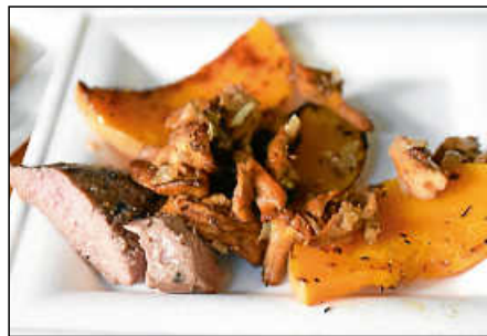
Ob Rehrücken auf Kürbis mit Pfifferlingen ...