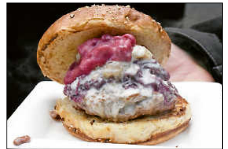
... Reh-Burger mit Rotkraut und Preiselbeeren ...

inzwischen den Rehrücken in Streifen und würzte sie mit Salz und Pfeffer. Auf dem darüber liegenden Grillteller lagen bereits Butternut-Kürbisscheiben. Nach relativ kurzer Zeit waren die Rückenstreifen gar. In Stückchen geschnitten wurden sie mit dem Kürbis, den Pfifferlingen und Zwiebeln zusammen mit einem vorwiegend aus Petersilie bestehenden Gewürzdipp serviert.