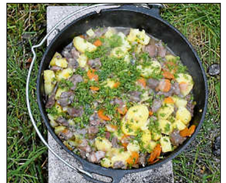
... oder Rehulasch im Feuertopf (Dutch-Oven) auf glühenden Eierbriketts – die Reh-Variationen waren alle äußerst lecker.

Ins Gulasch kamen neben Salz und Pfeffer, ein Wildgewürz, ein Fonds, Rotwein, hinzu Kardamon, Zimt und Petersilie. Karotten köchelten mit und der ausgebildete Koch fügte am Schluss noch vorgegarte Kartoffeln hinzu. Die seien auch gut, um das Gericht zu binden.