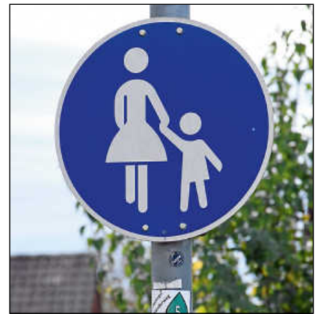
Wie sieht es mit Plochingens Fußwegen rund ums Untere Schulzentrum aus? Das möchte der Fußverkehrs-Check erkunden.

Zu Fuß zu gehen sei die „gesündeste Art der Fortbewegung“, unterstrich Reiner Nußbaum (CDU). Er bat darum, das Thema Elterntaxis „intensiv zu besprechen“, da ihm diesbezüglich über teils „chaotische Zustände“ berichtet wurde. „Wir erwarten uns Impulse dazu“, so Nußbaum. Es gelte, Nägel mit Köpfen