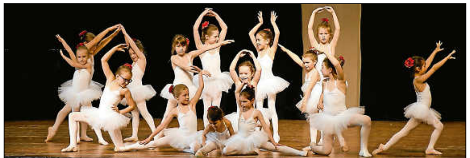
Ausdrucksstark, leichtfüßig und wendig: die jungen Ballettschülerinnen zeigten tolle Choreografien.