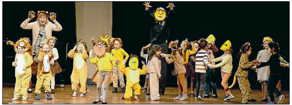
Das Musikzügles präsentierte aus „Karneval der Tiere“ unter anderem den „Königlichen Marsch des Löwen“.