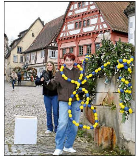
Auch das Ottilienbrünnele wurde mit einer Girlande in den Plochinger Farben geschmückt.