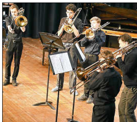
Das Posaunen-Quintett beim Jahreskonzert.