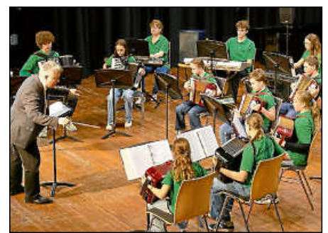
Mit schwungvollen Liedern sorgten die Crazy Akkordeon Kids für beste Stimmung.