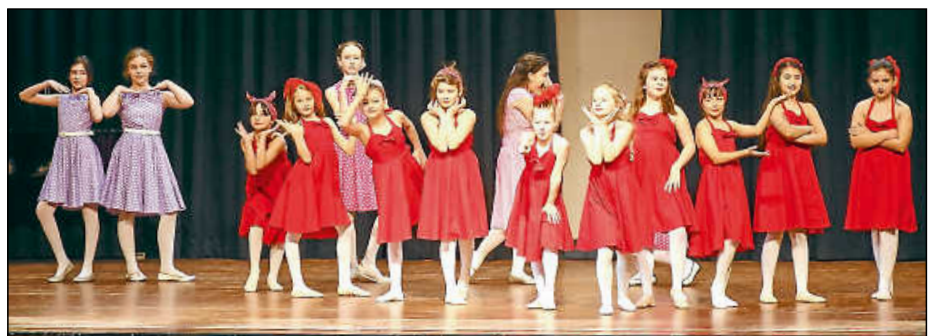
Die Choreografien der schon etwas größeren Tänzerinnen waren nicht minder ausdrucksvoll.