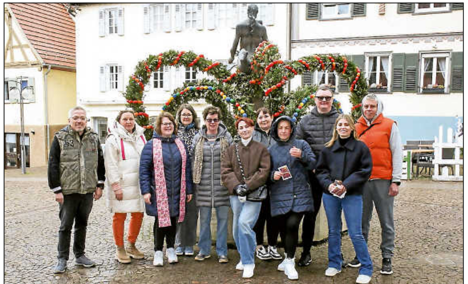
Geschafft! Der Osterbrunnen ist geschmückt und gesegnet zur Freude aller.

Mal mit noch drei Männern – könnten wir's nicht machen.“ Und diese brachten sich auch wieder am Donnerstag trotz Graupelschauern und kaltem Wind mit großem Einsatz ein, um das Werk zu vollenden. Ein Foto des Osterbrunnens aus dem vergangenen Jahr der Geschäftsstellenleiterin des AKPV Meyra Kalebun diente dazu als Vorlage, um die farbigen Eiergirlanden gemäß der Konzeption anzubringen.