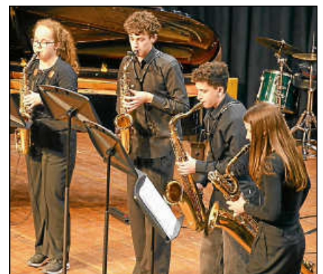
Das Saxophon-Quartett bei seiner Premiere.