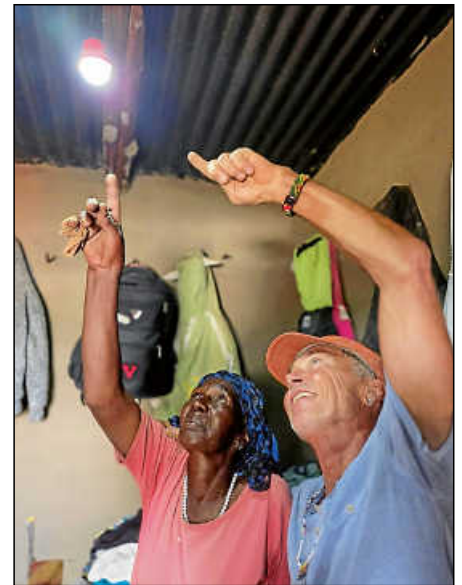
Die Freude über den neuen Stromanschluss ist groß.

„Die Reaktionen der betroffenen Familien sind sehr berührend, die Menschen sind unglaublich dankbar“, berichten