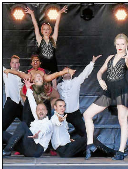
Der Sonntag steht ganz im Zeichen der Plochinger Vereine. Auf beiden Bühnen zeigen sie ihr Können – darunter die Rocking Stars mit fetzigen Tanzeinlagen.