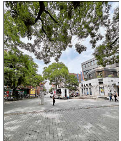
So zeigt sich der aktuelle Zustand am Fischbrunnenplatz.

Kurzfristig sind laut Stadtverwaltung punktuell kleinere Verbesserungen bei-