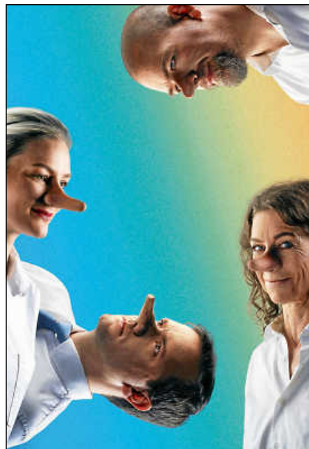
„Die Wahrheit“, Gastspiel der Badischen Landesbühne.