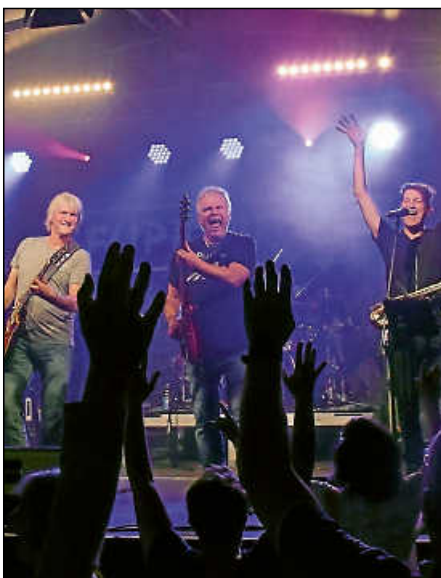
Wenn die Flippmanns die Marktplatzbühne übernehmen, ist gute Stimmung garantiert. Die Kultband sorgt am Freitagabend für einen schwungvollen Auftakt ins Marquardtfest-Wochenende.

Natürlich kommt auch das leibliche Wohl nicht zu kurz. Die Plochinger Vereine verwöhnen ihre Gäste das gesamte Wochenende über mit einer vielfältigen Auswahl an Speisen und Getränken und zeigen dabei einmal mehr, wie viel Engagement und Gemeinschaftsgeist in der Stadt steckt.