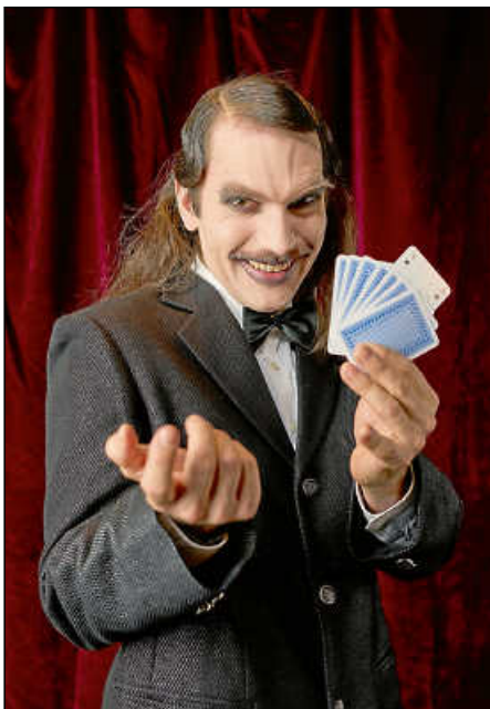
„Mario und der Zauberer“, Gastspiel der Badischen Landesbühne.