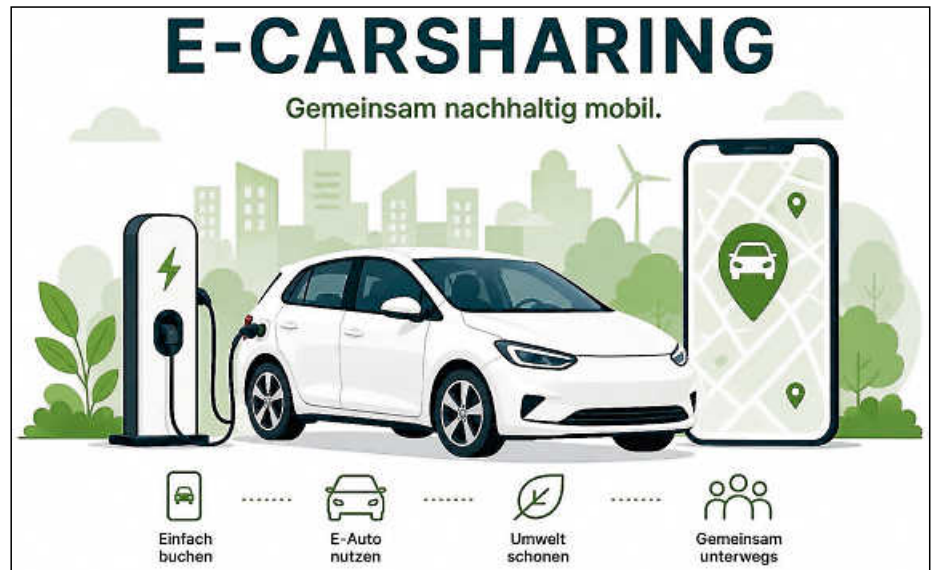
Die Deer GmbH mit Sitz in Calw wird das E-Carsharing nach Plochingen bringen. Grafik Ki-generiert

Das Netz der Deer-Stationen wächst kontinuierlich und umfasst inzwischen mehr als 520 E-Carsharing-Stationen im Süddeutschen Raum. Mit Plochingen, Reichenbach an der Fils, Frickenhausen, Baltmannsweiler und Wolfschlugen