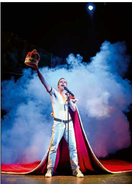
„Show Must Go On – ein Tribut an Freddie Mercury“, Gastspiel der Landesbühne Rheinland-Pfalz.

Was als unbeschwerter Familienurlaub an der italienischen Küste beginnt, wird für eine deutsche Familie zunehmend von Ausgrenzung, Nationalismus und unterschwelliger Bedrohung überschattet. Die Hoffnung auf Zerstreuung setzt die Familie schließlich in den gefeierten Zauberkünstler Cipolla. Doch der charismatische