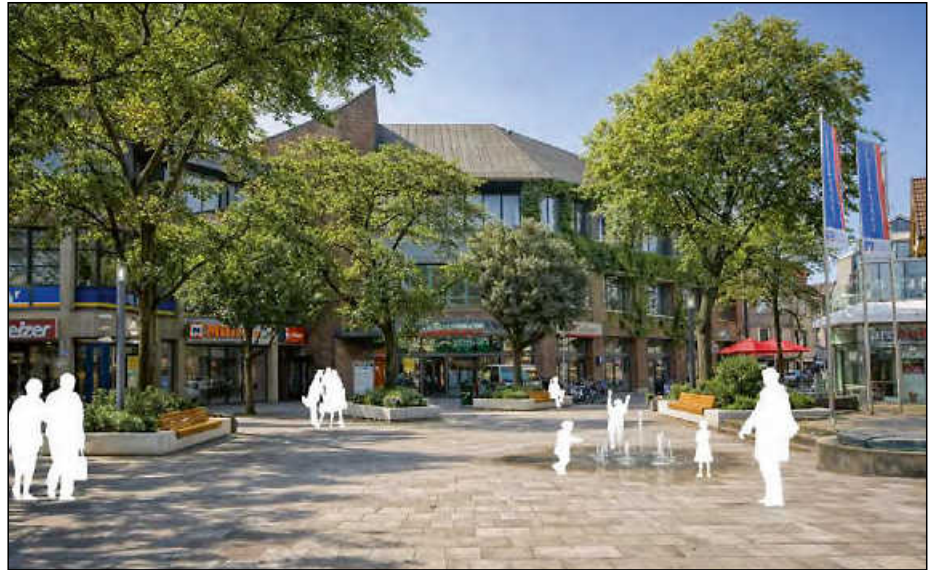
Visualisierung möglicher Maßnahmen am Fischbrunnenplatz. Grafik: KI-generiert und EGL

Positiv hob Gula hervor, dass es „Wasser in unterschiedlichen Formen“ gebe. Das Ambiente sei schön, habe einen attraktiven Marktplatz und erfahre eine gewisse Lebendigkeit durch die Topografie. Ebenfalls positiv seien die Baumstrukturen am Fischbrunnenplatz und zumindest gebe es einen barrierefreien Streifen.