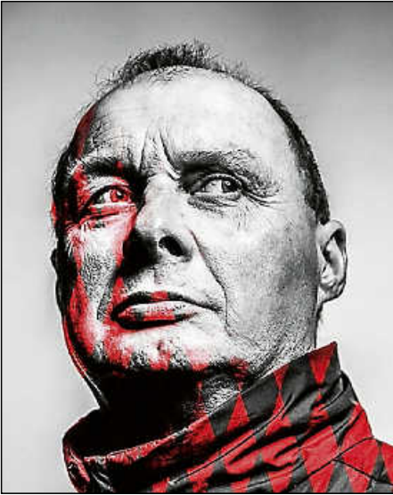
„Der Menschenfeind“, Gastspiel des Landestheaters Detmold.

Die Komödie „Der Menschenfeind“ von Molière kommt am Montag, 23. März 2026 auf die Stadthallenbühne. Alceste hat sein Herz an die junge Witwe Célimène verloren. Diese ist ihm gegenüber nicht abgeneigt, doch sie genießt auch die Geselligkeit, hat viele Verehrer und liebt es zu flirten. Für Alceste als „Mann mit Grundsätzen“ ist dies ein harter Schlag. Kompromisslos und unerbittlich weigert er sich, Zugeständnisse an Höflichkeit und Etikette in jeglicher Form zu machen.