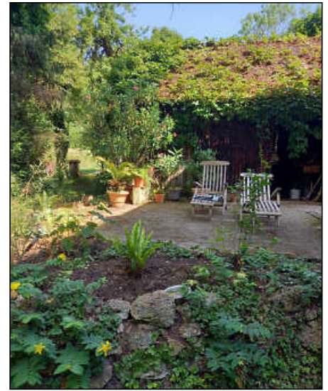
Der Garten von Ingeborg Kieckhäfer in Altbach erhielt den 1. Platz.