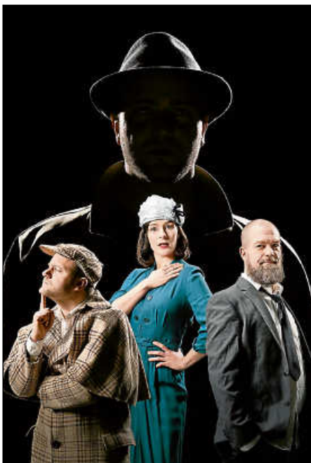
„Mord auf Schloss Haversham“, Gastspiel der Badischen Landesbühne.

Als reisender Schreiber macht Jörn Klare seine Recherche zum Ausgangspunkt eines Theaterabends, der nationalen Identitätsbegriffen ebenso wie Marketingslogans entsprungene Verballhornungen wie „The Länd“ entgegentritt. Heimat und Theater als Orte der Gemeinschaft und des Schaffens zusammenführend, arbeitet Klare an einem absolut gegenwärtigen theatralen Porträt unserer Region in der Welt. Ein radikal regionaler Theaterabend von Villingen-Schwenningen über Sigmaringen, Balingen und Tübingen bis Schwäbisch Gmünd.