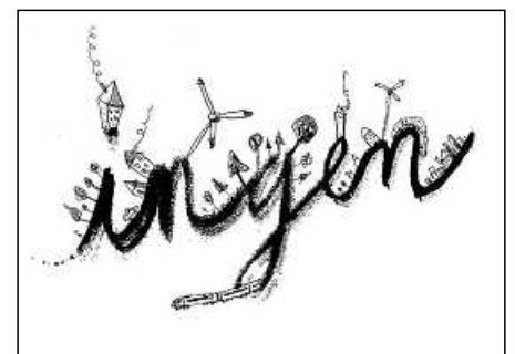
„... worin noch niemand war – Ein Heimatabend“, Gastspiel des Landestheaters Tübingen. Grafik: Peter Engel