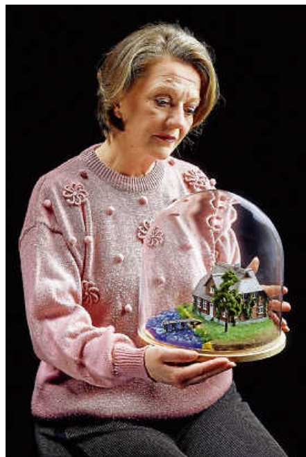
„Heimsuchung“, Gastspiel der Badischen Landesbühne.