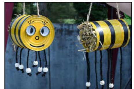
Aus alten Konservendosen wurden Insektenhotels gebastelt.