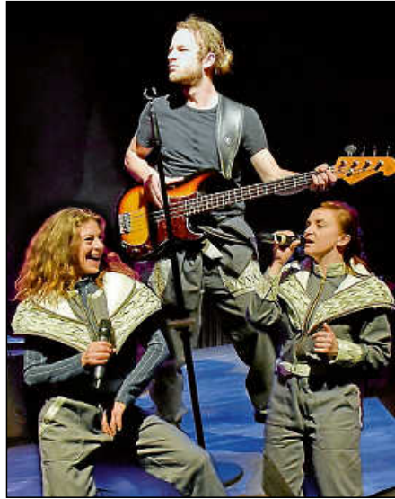
„Loving the Alien – Ein David-Bowie-Abend“, Gastspiel der Badischen Landesbühne.

Auf einer Kiesgrube in Nordbaden stürzt ein Raumschiff ab. Eine Person klettert aus den Trümmern und verschwindet. Eine Expeditionstruppe aus Musikern und Schauspielern macht sich sofort auf den Weg, um das