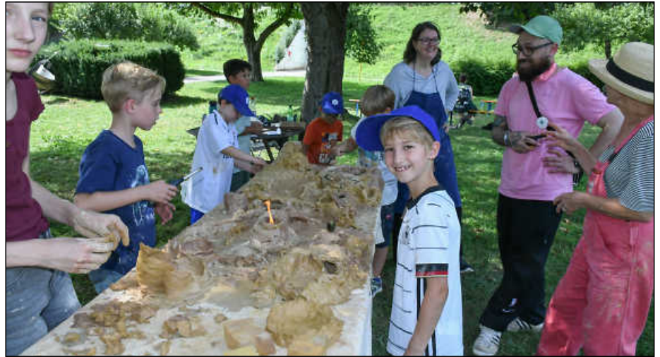
Grenzenlose Kreativität und Fantasie: Die mit Ton geformten Matschlandschaften, in denen Vulkane brannten und in Seen getonte Dinosaurier und Krokodile sich zeigten, fanden bei den Kindern großen Anklang.

Vergangenen Donnerstag gestalteten zehn Mitglieder des EINEWELT-Vereins an verschiedenen Stationen das Ferienprogramm.