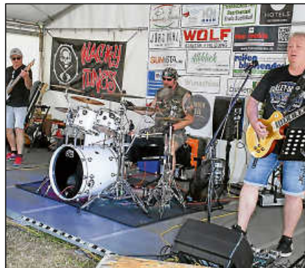
Auf der „Hauptbühne“ im Festzelt rockte am Sonntag die Plochingener Band „Wacky Tunes“.