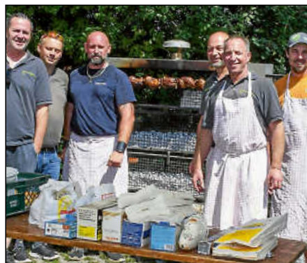
Mitglieder des Kleintierzüchtervereins grillten wieder viele leckere und knusprige Hähnchen.