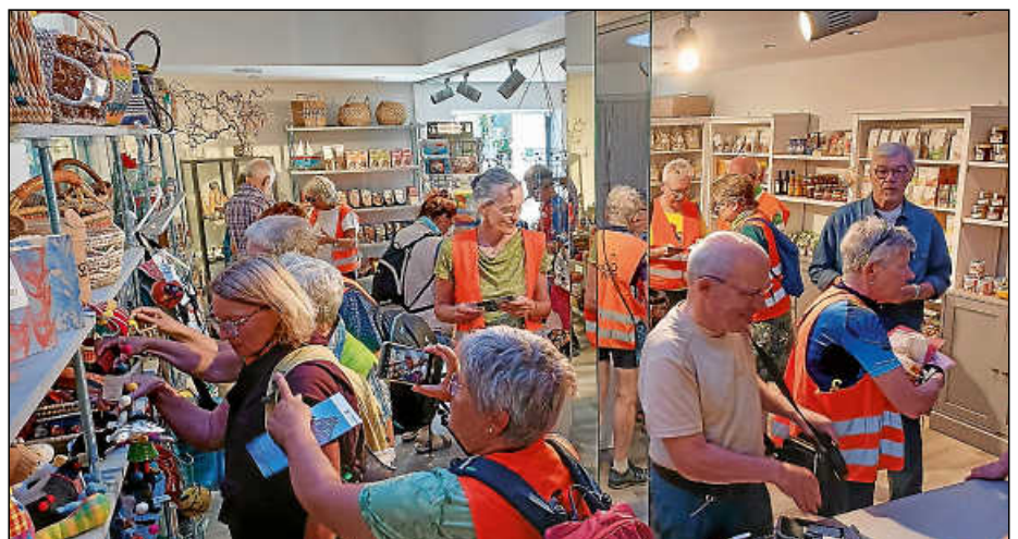
Der Laden war proppenvoll, Waren wurden unter die Lupe genommen und Erfahrungen ausgetauscht.

Die Öffnungszeiten des Plochinger Weltladens in der Marktstraße 30 sind: Mo 10-13 Uhr, Di und Do 14.30-18.30 Uhr, Fr und Sa 9-13 Uhr. Während der Sommerferien bis einschließlich 8. September montags geschlossen.