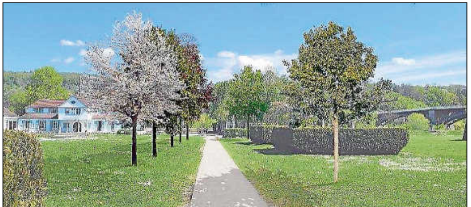
Das soll sich durch eine Schattenallee mit verschiedenen Baumarten ändern.