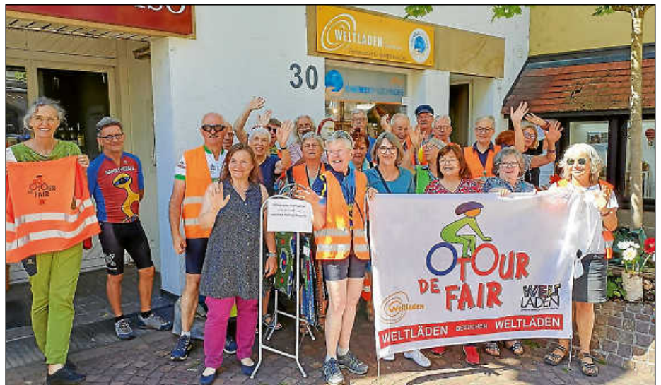
Radlerinnen und Radler der Tour de Fair besuchten den Plochinger Weltladen in der Marktstraße.

Etwa 800 Weltläden gibt es in Deutschland. Die meisten Läden werden – wie in