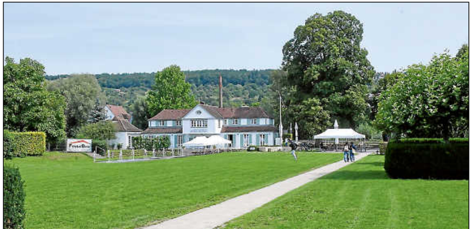
Entlang der Wege gibt es am Bruckenwasen wenig Schatten, weil Bäume rar sind.

Tobias Gula veranschaulichte anhand animierter perspektivischer Detailbilder potenzielle Entwicklungen und Varianten. Bereits vorhandene Bäume sollen durch zusätzliche ergänzt werden. Auf der „grünen Wiese“ sei dies „relativ einfach realisierbar“. An Stellen, an denen keine Neupflanzungen vorgenommen werden können, habe dies im wahrsten Sinne des Wortes einen tieferen Grund: Dort liegen Leitungen im Boden.