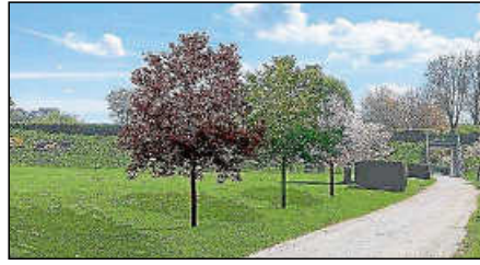
Bis zur Unterführung beim Kinderspielplatz „Kontiki“ könnte die Schattenallee gehen.

Die Baumpflanzungen seien „ein kleiner Baustein zum Klimaschutz“, sagte Bernd Koch (CDU). Und die 80-prozentige Förderung sei „eine Nummer“. Über das Bewässerungskonzept sollte man allerdings noch nachdenken.