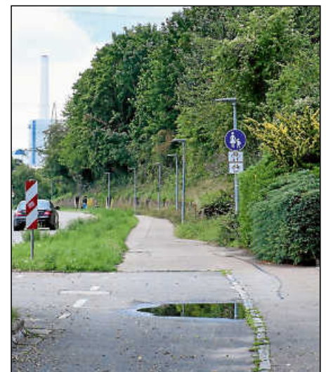
Der Fuß- und Radweg zwischen Plochingen und Altbach ist stark sanierungsbedürftig.

In einer Stellungnahme begrüßte das Polizeipräsidium Reutlingen die Maßnahmen und wies darüber hinaus auf die Notwendigkeit einer Beleuchtung hin. Diese wurde inzwischen umgesetzt.