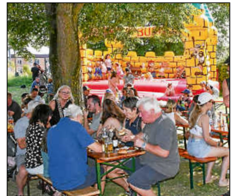
Kinder und Familien vergnügten sich auf der Hüpfburg, im Zelt oder im Schatten.

dem Stumpenhof sonst kein großes Fest mehr. Außergewöhnlich sei, dass von 60 Vereinsmitgliedern 54 beim Fest mitmachen, freute er sich.