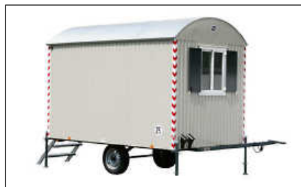
Ein Bauwagen soll zum Taubenschlag werden.

Nachhaltige Begrenzung der Population Das „einzig wirksame Mittel“ sei ein Taubenhaus, das bewirtschaftet wird, um einige Eier wegzunehmen und die Populationsstärke zu reduzieren, sagte der Leiter des Verbandsbauamts Wolf-