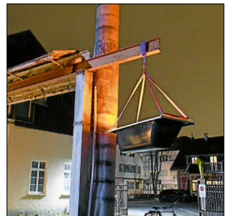
Eine Badewanne schwebte über dem Hof im Kulturpark Dettinger.

text gesetzt erscheinen sie in gewisser Weise „poetisch“ – sei es die schwebende Kloschüssel oder die in Ketten hängenden Steine. Mit seinen „Spontaninstallationen“, bei denen er vieles erst während der Installation entdeckt, experimentiere und bezaubere der Künstler. Cleemann verwandelte die Steingießerei in ein „Wochenendhaus“ mit Schaukel, Säulen und Toilette. Akustisch untermalt er das mit Ketten geformte, bewegliche Haus mit Geräuschen, die aus einem in-