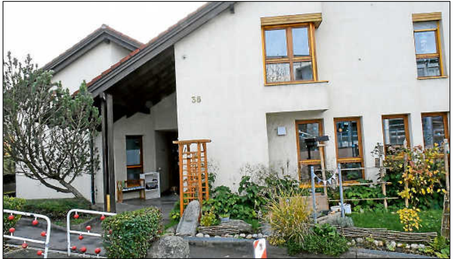
Das Gebäude Brühlstraße 36, in dessen Erdgeschoss sich der Kindergarten St. Konrad befindet.

Ein Blick auf den Haushaltsentwurf zeige deutlich die Dimension dieses Themas: Für das Jahr 2026 seien 10,5 Mio. Euro für die Kinderbetreuung eingeplant – bei einem Defizit von rund 8 Mio. Euro. Auch die etwa 150 Mitarbeitenden seien „eine ernstzunehmende Größe“. Bei der Übernahme habe die Stadt mit der Kirchengemeinde „sehr faire Verhandlungen geführt“. Der Kaufvertrag sei vor wenigen Wochen unterschrieben worden. Die Betriebsübergabe soll im Januar 2026 erfolgen. Die Einrichtung mit 50 Kindern soll zunächst weiter 2-gruppig betrieben werden. Noch ist nicht ganz klar, wie der Kiga weiterentwickelt werden soll. Eine umfassende Sanierung sei jedoch erforderlich, auch um eventuell weitere Gruppen für die Ganztagesbetreuung schaffen zu können. Das Personal werde jedenfalls von der Kirche zur Stadt wechseln. Die technische Planung werde das Verbandsbauamt gemeinsam mit dem Team, den Kindern und Eltern übernehmen, sie müsse auch „ins Gesamtbild passen“. Um Transparenz zu schaffen, sollen die Eltern baldmöglichst informiert werden. Für die „von partnerschaftlichen Gedanken getragenen Gespräche mit der Kirchengemeinde“, bedankte sich Buß herzlich. Am besten wäre, wenn weder die Kinder, noch die Eltern vom Wechsel viel mitbekommen würden, meinte er.