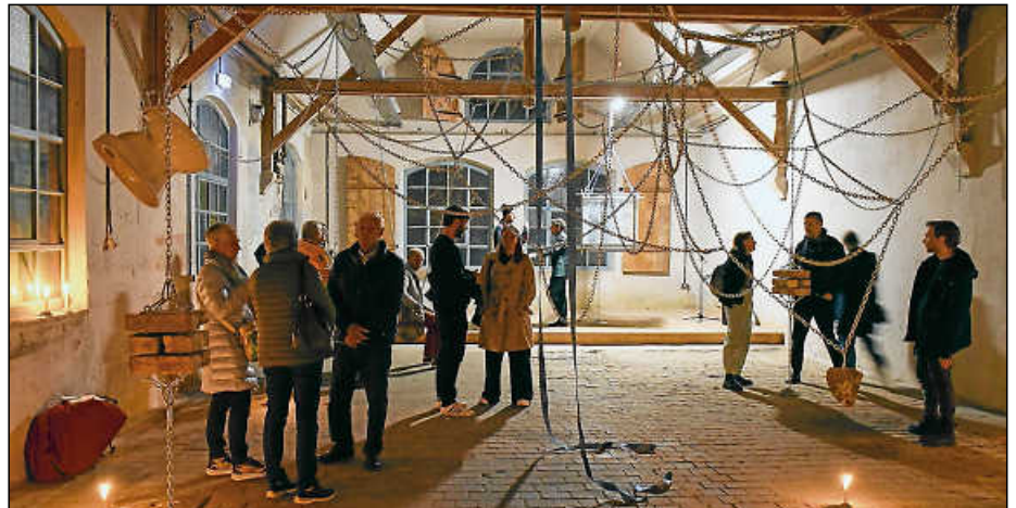
Der Künstler verwandelte die Steingießerei in ein aus Ketten gebildetes Wochenendhaus.