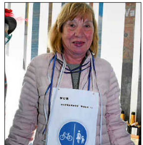
Getrennte Wege für Radfahrer und Fußgänger war eine der Forderungen der Kontaktfrauen.

Ein weiterer Sketsch, gespielt vom Voll-