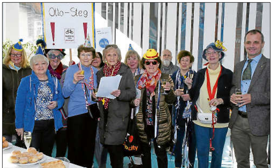
Die Kontaktfrauen demonstrierten für ein „Radfahr-Absteig-Gebot“ auf dem Otto-Steg, für getrennte Rad- und Fußgängerwege und gegen einen Radschnellweg durch den Brückenwasen.

Ein weiterer Punkt ihrer Anklage betraf die Unterführung und den Otto-Steg. „Von der Unterführung über den Steg, quer über den Wasen im Neckarvalley wird veranstaltet eine heiße Fahrradrallye.“ Werde nichts gegen den dortigen Radverkehr sowie den