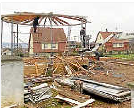
Der Pavillon, zerlegt in Tausend Einzelteile.