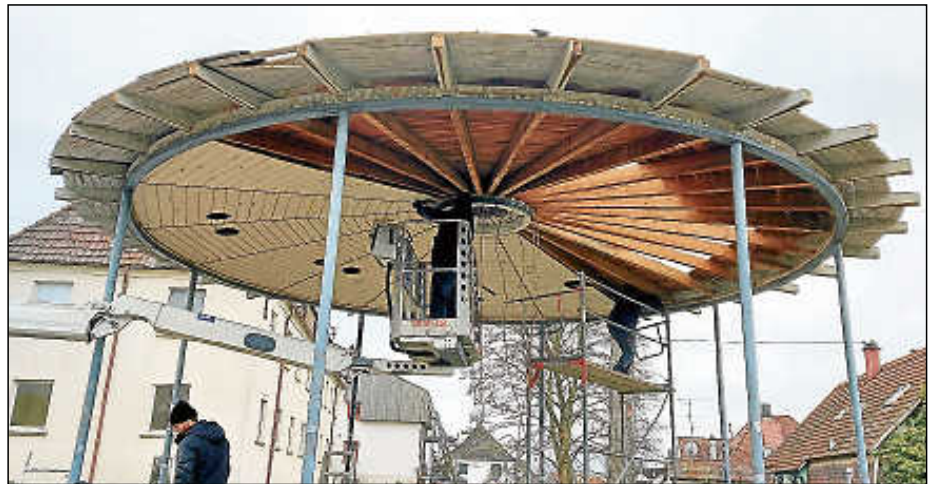
Bei der Demontage des Pavillons.