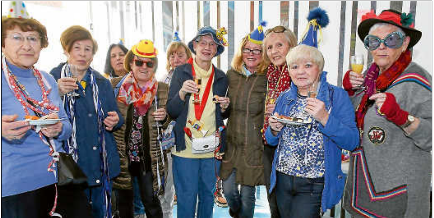
Ein Hoch auf die „Weiberfasnet“ – nach ihrer Vorstellung ließen die Kontaktfrauen den Schmutzigen Donnerstag im Rathaus ausklingen.

Buß noch eine Rüge: „Herr Buß, das muss man mal hinterfragen, ob Sie unsere Tipps und Vorschläge jährlich unterschlagen? Wir hatten immer so tolle Ideen, die wir fast alle nicht umgesetzt sehen! Scho möglich, dass die noch in Ihrer Amtsschublade stragged oder im hintersche Amtskämmerle versacked ond unter ama Berg von Kisten und Listen ihr jämmerliches Dasein fristen.“ Der Schultes sollte besser eine Machbarkeitsstudie in Auftrag geben, ansonsten wollen die Kontaktfrauen mit ihren Anliegen den Gemeinderat aufsuchen. Sie wollen „nicht nerven, nur die Dringlichkeit schärfen“ – was ihnen mit Nachdruck gelungen sein durfte.