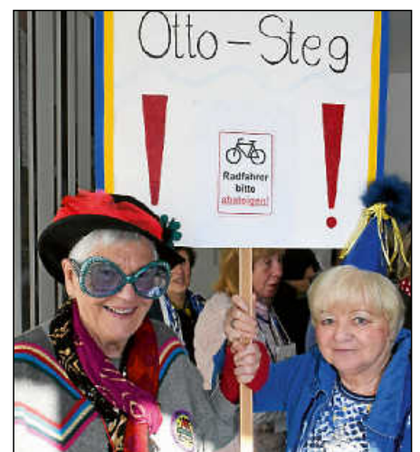
Geht es nach den Kontaktfrauen, sollen Radler auf dem Otto-Steg künftig schieben.

Radschnellweg unternommen, erwägen die Kontaktfrauen, auch radikale Protestformen zu ergreifen: „Herr Buß, wollen Sie das noch erleben, dass wir uns auf den Otto-Steg kleben?“ Der Otto-Steg sei aufgrund der vielen Radler nur unter Lebensgefahr zu Fuß begehbar, weshalb die Frauen dort ein „Fahrrad-Absteig-Gebot“ fordern. Und „ein Radschnellweg im Brückenwasen nimmer und nie, bestenfalls an der Peripherie“. Nachdem kaum eine Trasse im engen und zugebauten Neckartal für den Radweg gefunden werden kann, sehen die Kontaktfrauen „freilich noch Alternativen: Wir könnten die Radler auf Seilbahnen hieven!“ Und anstatt auf dem Otto-Steg zu fahren, könnten die Drahtesel auch mittels einer Fahrradfähre auf die andere Neckarseite befördert werden. Schließlich schlugen die gnadenlosen Frauen auch noch eine Fahrradsteuer vor, um der Radlerschar Einhalt zu gebieten.