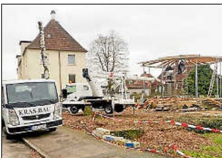
Die Otto-Wurster-Anlage ist weitgehend abgeräumt: Bäume sind gefällt und der Pavillon ist abgebaut.