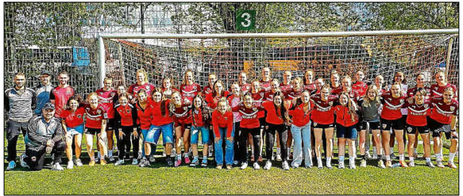
Gruppenbild beim Trainingsbesuch mit den VfB-Profspielerinnen auf dem Trainingsgelände.

Abends lud der CVJM zum gemeinsamen Grillfest ins CVJM-Häusle, wo man noch lange miteinander zusammensaß. Bei der Verabschiedung am nächsten