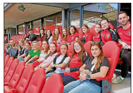
„Ehre, wem Ehre gebührt“ – die Spielerinnen in den Ehrenlogen der Cannstatter MHP-Arena.