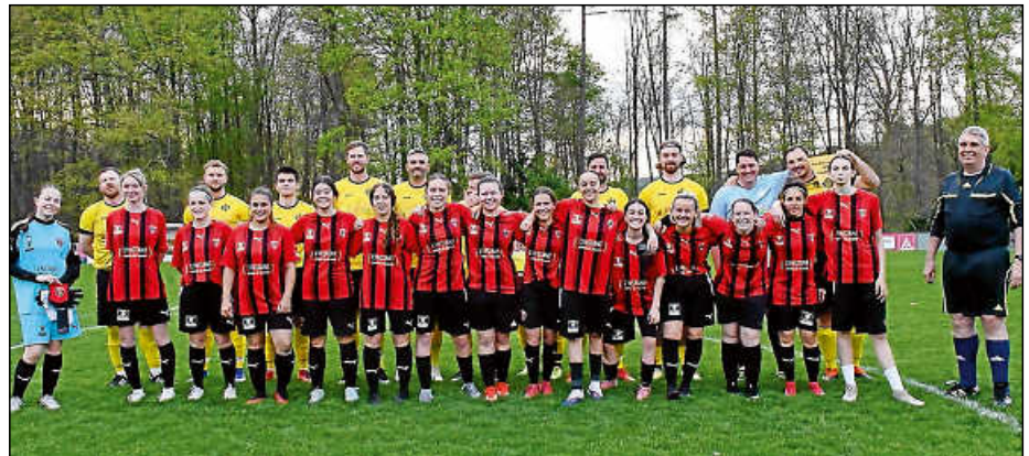
Auf dem Pfofenberg vor dem Anpfiff der Partie der Fußballerinnen von Stade St. Aubinais gegen die 2. Mannschaft des FVP.