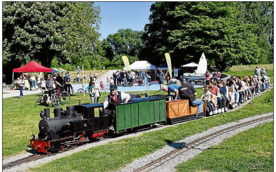
Bei den Dampfbahnern kann man mit einer Dampfeisenbahn quer durch den Park fahren.

Das ausführliche Programm zum Bruckenwasenfest finden Sie unter: www.plochingen.de/bruckenwasenfest oder in der Ausgabe des Amtsblatts KW 19.