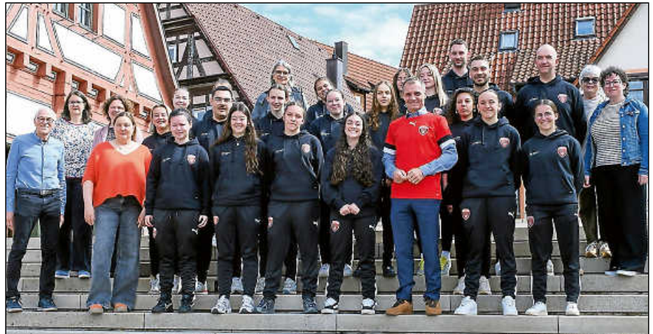
Nach dem Empfang der französischen Damenfußballmannschaft hinter dem Alten Rathaus.

Beim anschließenden gemeinsamen Abendessen in der Vereinsgaststätte auf dem Pfofenberg wurden die letzten Sprachbarrieren schnell überwunden.