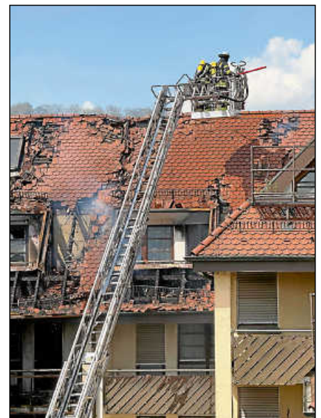
Mithilfe zweier Drehleitern konnte der Brand im Mehrfamilienhaus in der Karlstraße gelöscht werden.

Letztlich waren sechs Wohnungen betroffen. Deren Bewohnerinnen und Bewohner konnten zunächst, bis auf zwei Familien und eine Einzelperson, alle bei Familien oder Bekannten unterkommen. Für die weiteren betroffenen Familien sorgte die Stadt Plochingen für eine Unterkunft. Das Ordnungsamt wurde frühzeitig zum Einsatz hinzugezogen und organisierte die Unterbringung. Die restlichen Bewohner konnten teilweise noch während des Einsatzes wieder in