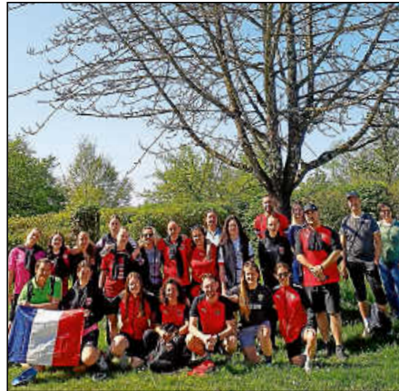
Unter dem Plochinger Cormier, dem „Freundschaftsbaum“ am Albvereinsturm.