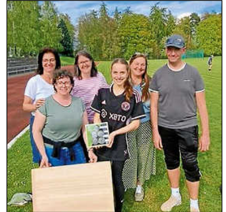
Bei der Übergabe des „Palets breton“ auf dem Jahnstadion.

Morgen wurde eine herzliche Einladung zum Gegenbesuch ausgesprochen – ein