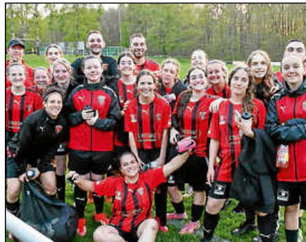
Es hat – trotz Niederlage – im Auswärtsspiel Spaß gemacht: Alle Mädels waren auch nach dem Abpfiff noch fröhlich.