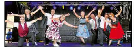
Die RockingStars schwingen am Sonntag das Tanzbein auf der Marktplatzbühne.