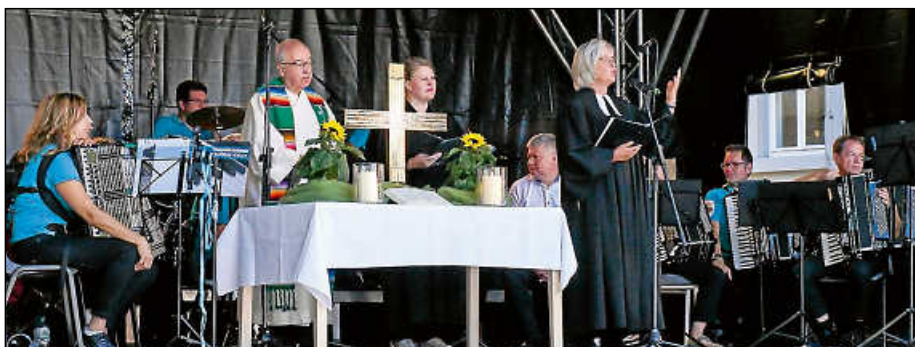
Am Sonntag um 10 Uhr findet auf dem Marktplatz ein Ökumenischer Gottesdienst statt. Die Plochinger Kirchengemeinden laden hierzu herzlich ein.