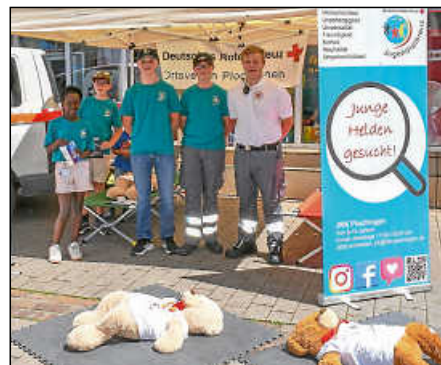
Das DRK ist am Sonntag wieder mit dem beliebten Bärenhospital dabei.

Zum Kinderflohmarkt „von Kindern für Kinder“, der am Sonntag ab 11 Uhr während des Festes stattfindet, kann man sich noch per E-Mail anmelden: geschaeftsstelle@plochinger-vereine.de (kommerzielle Händler sind nicht zugelassen).