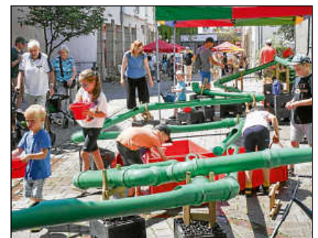
In der „Pfisterer-Kinderspielestadt“ kommt am Sonntag keine Langeweile auf!