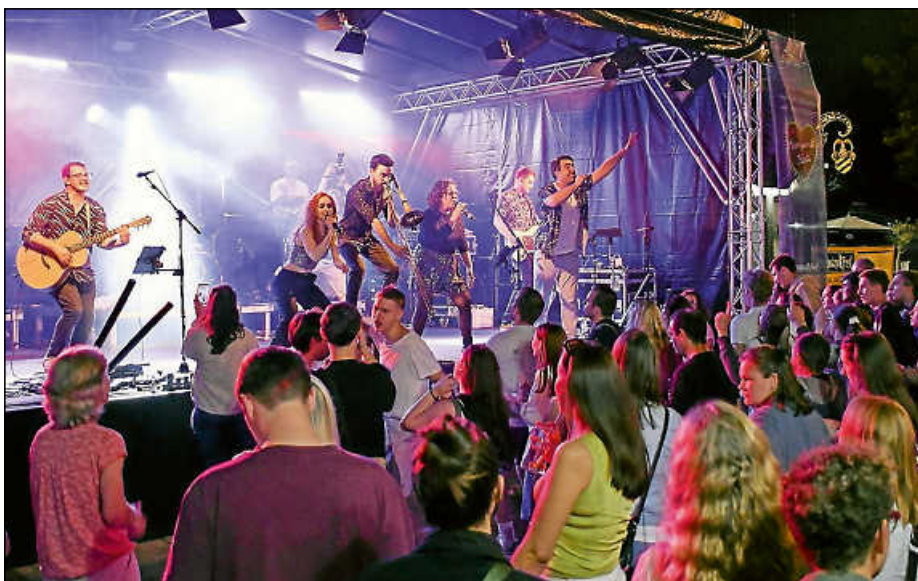
Die Partyband Clap's Tool sorgt am Freitagabend für gute Stimmung auf dem Marktplatz.