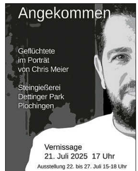
Plakat zur Ausstellung „Angekommen“.

Die 15 in Plochingen porträtierten Menschen stammen aus Afrika, Syrien, Iran, dem Irak und der Ukraine. Sie eint das einschneidende Fluchterlebnis. Ein Großteil davon kam vor rund zehn Jahren nach Deutschland. Chris Meier erstellte die Porträts und Interviews in Plochingen. Manche davon entstanden spontan, andere ganz gezielt mit längerem Vorlauf. Er habe dadurch „die Befindlichkeiten noch intensiver kennengelernt“, sagt er. Denn „die Person sollte zu mir sprechen, so wie sie ist“. Zur Vernissage werden auch für die Ausstellung Porträtierte anwesend sein.