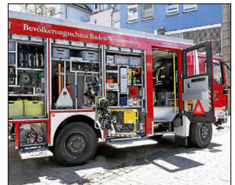
Bei der Freiwilligen Feuerwehr kann man sich die Einsatzfahrzeuge zeigen lassen.