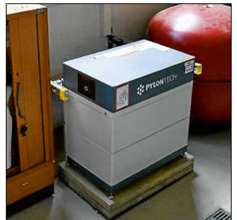
Der Batteriespeicher ist äußerst klein.