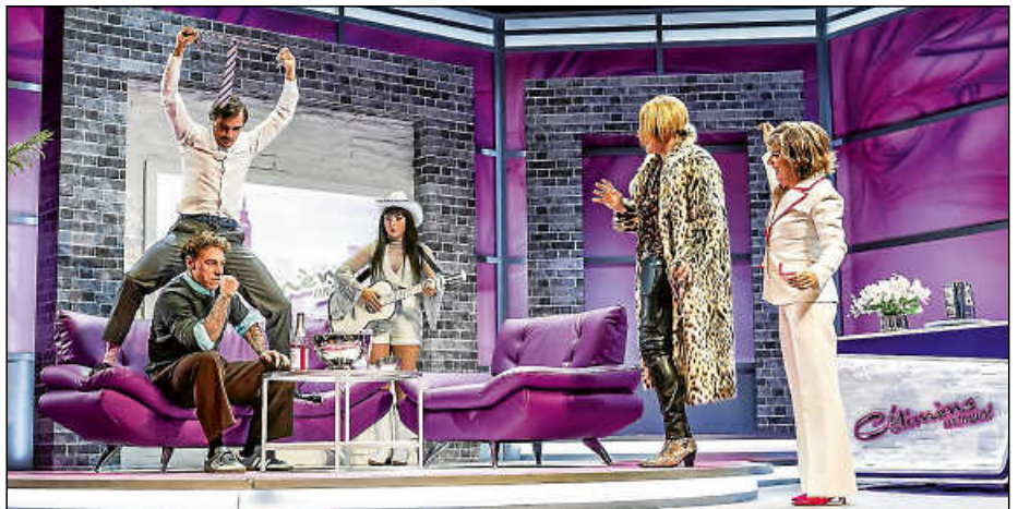
Das Jahrhunderte alte Bühnenstück modern inszeniert.