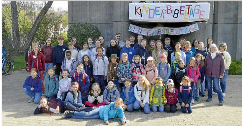
Sie alle erlebten spannende und abwechslungsreiche Kinderbibeltage in den Osterferien.