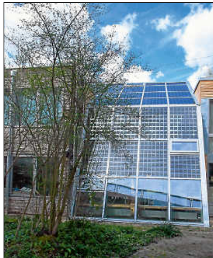
Wo einst die Blechverblendung war, spenden nun Solarmodule Schatten und liefern Strom.

Die herkömmliche Doppelverglasungsfläche wurde nun vollständig durch eine wärmedämmende Verglasung mit innenliegenden Photovoltaik-Elementen ersetzt. Diese von einer österreichischen Firma hergestellte Spezialverglasung erzeugt nicht nur Strom, sondern verbessert gleichzeitig die energetische Qualität des Gebäudes, weil die im Glas integrierten Solarzellen eine natürliche Beschattungsfunktion übernehmen, was vor allem im Obergeschoss den Kühlbedarf im Sommer reduziert und die Gesamtbilanz weiter verbessert. Wärme kann also nunmehr gespart und Strom produziert werden. Zudem speichert eine Batterie den tagsüber produzierten Strom, der dann abends