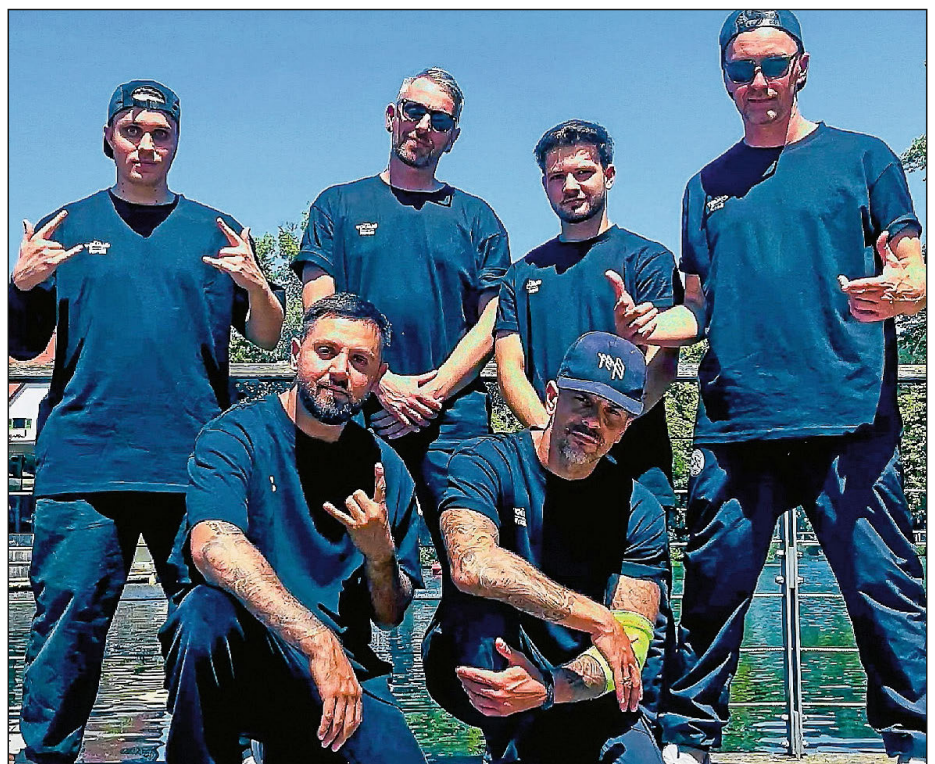
Die Battle Toys kehrten von der TAF Deutschen Meisterschaft im Breaking in Worms als Titelgewinner des Teamwettbewerbs der Erwachsenen nach Plochingen zurück.

Im Teamwettbewerb der Erwachsenen haben die Battle Toys am Ende gegen eine Gruppe aus Stuttgart gewonnen und den Deutschen Meistertitel klar gemacht. Die Erwachsenen bilden bei der Competition eine eigene Klasse für sich. Generell würden Gruppenwettbewerbe gar nicht mehr so oft ausgetragen. „Eine riesen Show auf die Beine zu stellen bedeutet großen Stress für die Gruppen“, sagt Stark – und zu guter Letzt gehe es am Ende doch nur darum, wer gewinnt den Titel und an die Show erinnere sich