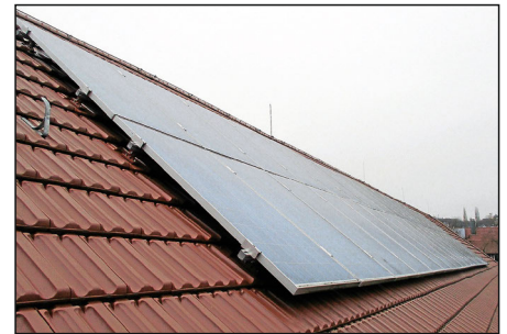
Die PV-Anlage auf dem Rathausdach.

Nach fristgerechter Registrierung stellt jede Hausbesitzerin oder jeder Hausbesitzer Daten bereit, so dass qualifizierte PV-Solar-Beraterinnen beziehungsweise -Berater eine individuelle Erstberatung erstellen können. Eine daraufhin gewünschte Erstplanung der PV-Anlage mit Kostenvorabschätzung ist der nächste Schritt (Kosten: 250 Euro). Die Kosten werden bei Auftragserteilung verrechnet. Bis zu einem Stichtag können sich dann alle Bündelpartnerinnen und