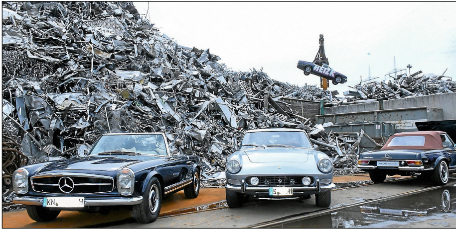
Ein alter Ferrari zwischen zwei historischen Daimler-Benz, am Kran dahinter hängt ein Jaguar.

Auf dem Recyclinghof kamen die wunderschönen Oldtimer noch besser zur Geltung