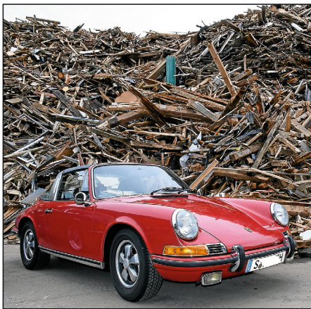
Ein roter Porsche 911 vor dem Altholzlager.