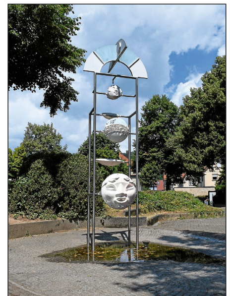
Zum Bedauern vieler fließt am Otto-Löffler-Brunnen vor der Stadthalle kein Wasser mehr.