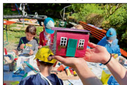
Wunderschöne Wildbienenhotels entstanden.

den Umwelt- und Artenschutz und trug so zum gelungenen und lehrreichen Verlauf des Projekts „NaturSpaß“ bei. Die Kinder bauten unter anderem Wildbienenhotels und erfuhren dabei, wie sie aktiv zum Schutz von Wildbienen und anderen Insekten beitragen können. Auch das SPIELmobil war Teil des Programms und sorgte für zusätzliche Spiel- und Bewegungsangebote.