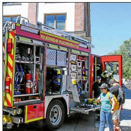
Bei der Freiwilligen Feuerwehr dürfen Einsatzfahrzeuge aus nächster Nähe bestaunt werden.