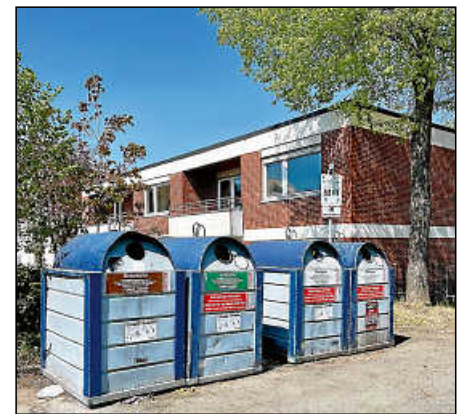
Die Containerstandorte sollen sauber bleiben.