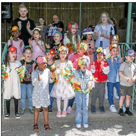
Der Parkkindergarten Bruckenwasen eröffnet das Fest um 11 Uhr mit viel Stimme und guter Laune.

Schach hält jung, Schach macht klug! Kommen und spielen Sie Jung gegen Alt, Rasenschach oder Familienschach. Ab 14:30 Uhr: Schauen Sie Profis über die Schulter beim „Bruckenwasen-Blitzschachturnier“.