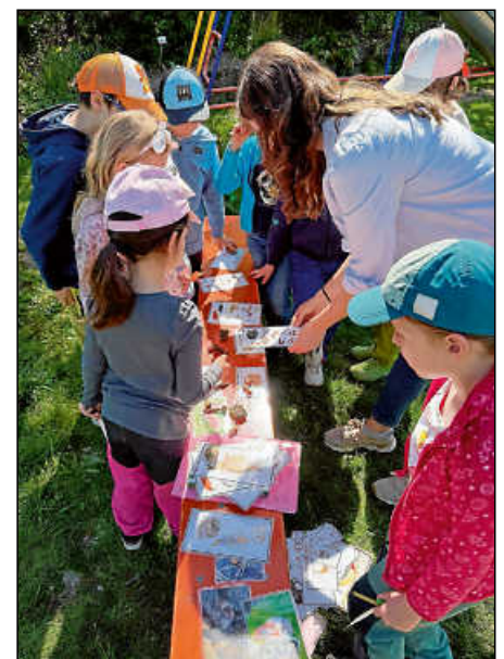
„NaturSpaß“ war auch sehr lehrreich.