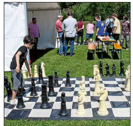
Hier wird groß gedacht: Schach mit XXL-Figuren bei den Schachfreunden und dem Stadtseniorenrat.