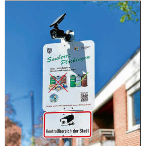
Neue Schilder bei den Containern sollen illegale Müllablagerungen verhindern.

ten, illegale Ablagerungen direkt beim Ordnungsamt zu melden oder die offiziellen Entsorgungswege über den Landkreis und die Wertstoffhöfe zu nutzen.