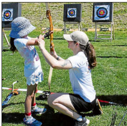
Mit Pfeil und Bogen die goldene Mitte treffen – auch für kleine Gäste beim Schützenverein.

Im kleinen Wasserbecken dürfen die jungen Besucher ihre Modellschiffe geschickt über das Wasser steuern oder beim Rettungsringwerfen ihre Treffsicherheit unter Beweis stellen und spielerisch ihr Geschick testen.