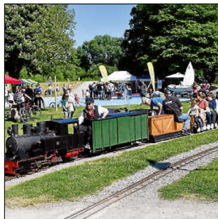
Pfeifend und dampfend drehen die Loks der Dampfbahner wieder ihre Runden.

Eiscafé Zanetti: Bunte Eisvielfalt für die