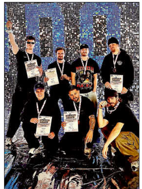
Die Crew der Battle Toys: So sehen die Europameister im Breaking aus Plochingen aus.

Mit dem Gewinn der Europameisterschaft setzten die Battle Toys ein starkes Zeichen für den Breaking-Sport in der Region und trugen den Namen Plochin-