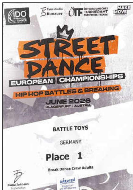
Die Urkunde bescheinigt den Battle Toys einen 1. Platz im Breaking.

Bereits in den Vorrunden überzeugten die Battle Toys mit Kreativität, Technik und Teamgeist. Für ihre beeindruckende Performance sicherten sie sich in der Vorrunde die beste Show des Wettbewerbs. Im entscheidenden Final-Battle bewiesen die Plochinger Nervenstärke und lieferten eine mitreißende Vorstellung, die die Jury und das Publikum gleichermaßen begeisterte.