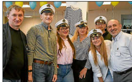
Hafenatmosphäre im Begegnungscafé.