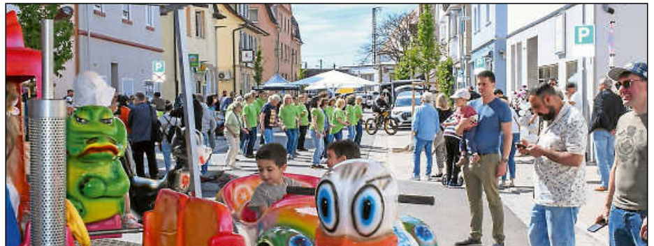
Karussell, Tanz und Stände belebten die beim Plochinger Frühling gesperrte Bahnhofstraße.

sowie zwei Ladesäulenstellplätze für Elektro-Fahrzeuge.