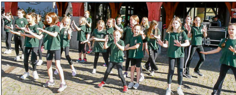
Die Kidsgruppe der Plochinger Rocking Stars bei ihrem Auftritt vor dem Alten Rathaus.