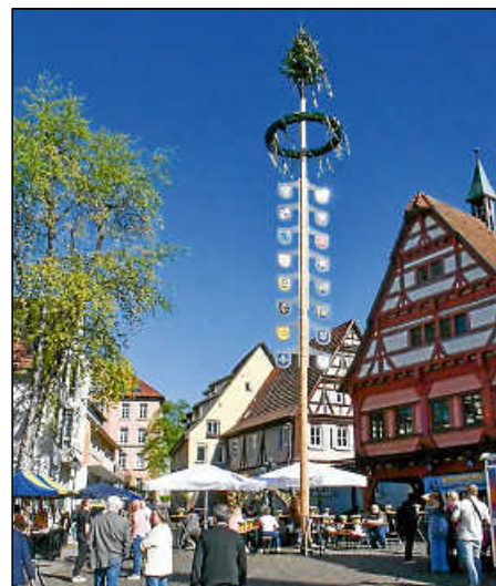
Plochingens Baum vor strahlend blauem Himmel.