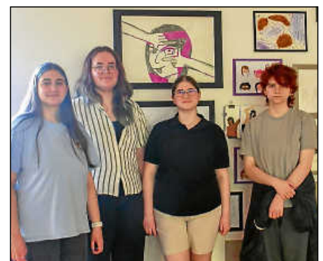
Die ältere Gruppe der Kunstwerkstatt.

Mit dem „Fest für alle im Lettenäcker“ hat der Stadtteil jedenfalls ein Gemeinschaftserlebnis hinzugewonnen.