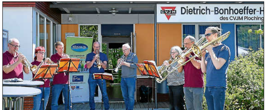
Der Posaunenchor Plochingen stimmte vor dem Dietrich-Bonhoeffer-Haus zum Festauftritt ein.