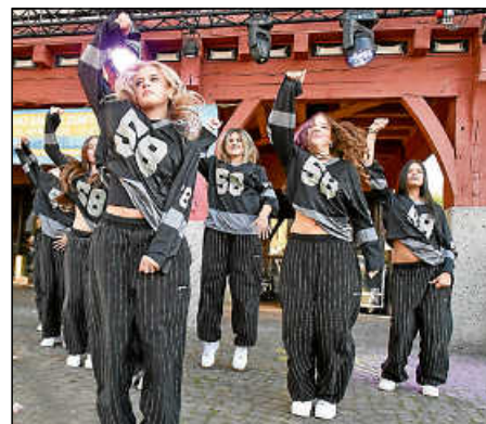
Die HipHop-Tanzgruppe PGMove des TV Hebsack.