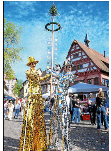
Die Stelzenläufer zeigten sich in neuem Kostüm.

Erlebnis, Einkauf und Genuss“ bringe die Leute her. War das Erlebnis toll, kommen sie auch wieder. Doch derzeit hätten viele Menschen auch andere Sorgen. Ähnlich äußerten sich auch mehrere Händler. Das Geld werde eher zurückgehalten. Doch der Plochinger Frühling bietet auch die Möglichkeit, sich zu präsentieren. Das war auch der Fahrradhändlerin in der Bahnhofstraße wichtig. Sie habe zwar kein Rad verkauft, aber in Plochingen wisse man jetzt, dass es in Ruit einen tollen Fahrrad-Shop gibt.