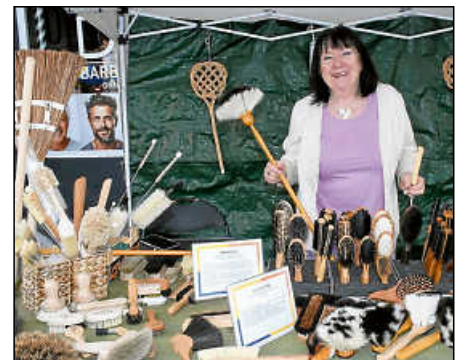
Die Bürstenbinderin aus dem Waldachtal.