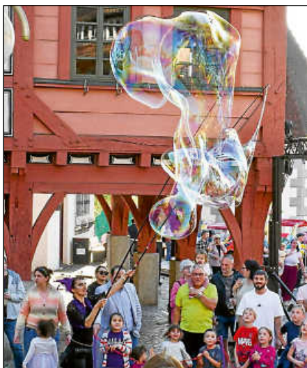
„Maya in Motion“ zauberte riesige Seifenblasen.