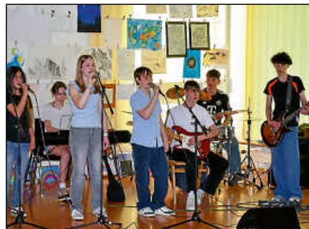
Die Band „Maniacs“ der Gemeinschaftsschule Deizisau bei ihrem Auftritt im DBH.

rinnen und Besucher mit tollen Songs. Im, hinter und vor dem DBH wuselte es und für die kleinen Gäste gab es wieder eine Hüpfburg zum Toben.