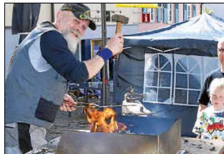
Schmiedekünstler aus Überzeugung.