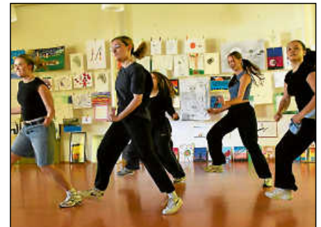
Neben den HipHop-Kids des place2b trat die HipHop-Gruppe „Flawless“ des Tanzkraftwerks auf.