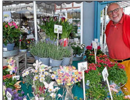
Ohne Blumen kein Frühling.