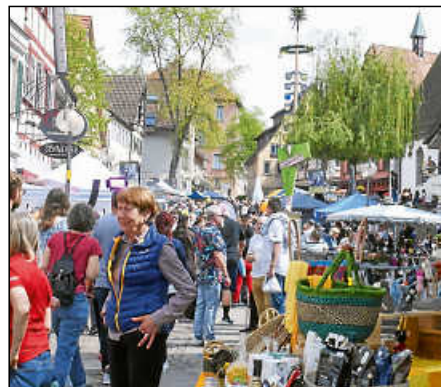
Es war viel los auf der Marktstraße.

Erlebnis, Einkauf und Genuss“ bringe die Leute her. War das Erlebnis toll, kommen sie auch wieder. Doch derzeit hätten viele Menschen auch andere Sorgen. Ähnlich äußerten sich auch mehrere Händler. Das Geld werde eher zurückgehalten. Doch der Plochinger Frühling bietet auch die Möglichkeit, sich zu präsentieren. Das war auch der Fahrradhändlerin in der Bahnhofstraße wichtig. Sie habe zwar kein Rad verkauft, aber in Plochingen wisse man jetzt, dass es in Ruit einen tollen Fahrrad-Shop gibt.