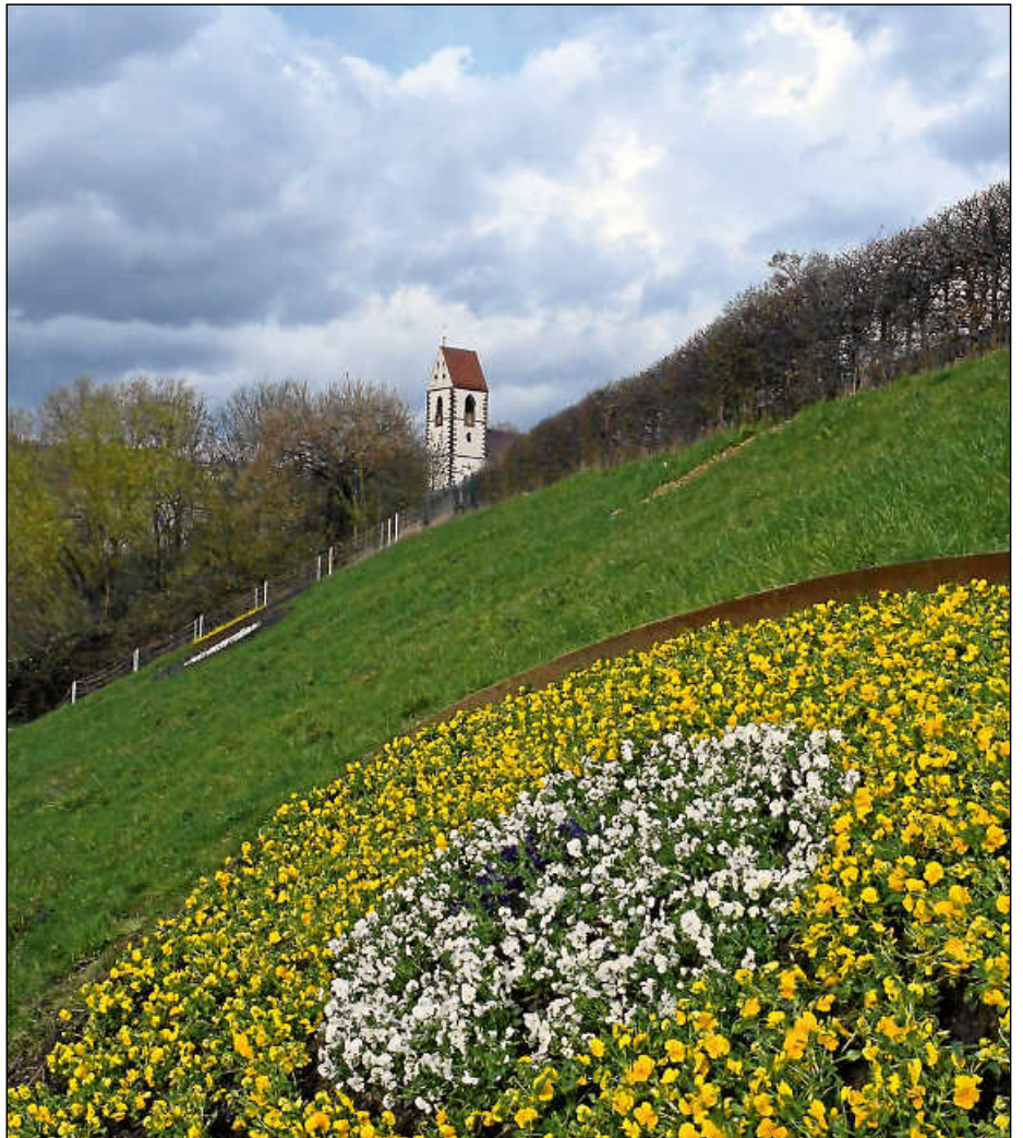
Die Gärtner verschönerten vorige Woche den Bruckenwasen mit bunten Stiefmütterchen.