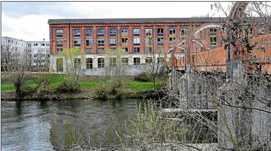
Zartes Grün umgibt die Alte Spinnerei und den Otto-Steg. Der Bruckenwasen steht vor der Blüte.