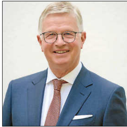
Seit dem Jahr 2000 Landrat: Heinz Eininger.

Bei der großen Verwaltungsreform 2005 wurden zehn Sonderbehörden und mehr als 400 Mitarbeitende erfolgreich in das Landratsamt Esslingen eingegliedert. Auch in Folge dessen wurden zwei Verwaltungsneubauten in den Jahren 2009 und 2020 in Esslingen und Plochingen umgesetzt. Derzeit ist das neue Landratsamt in den Esslinger Pulverwiesen im Bau, das 2025 fertiggestellt werden soll. In seine Amtszeit fiel unter anderem die Klinikstrukturreform der ehemaligen Kreiskliniken zu den medius-Kliniken mit drei Standorten. Außerdem wurden das berufliche Schulwesen und die sonderpädagogischen Bildungs- und Beratungszentren an allen Standorten neu gebaut oder grundlegend saniert.