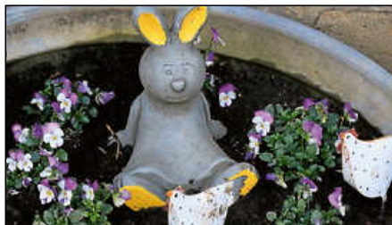
Ausgeruht grüßt der Osterhase.