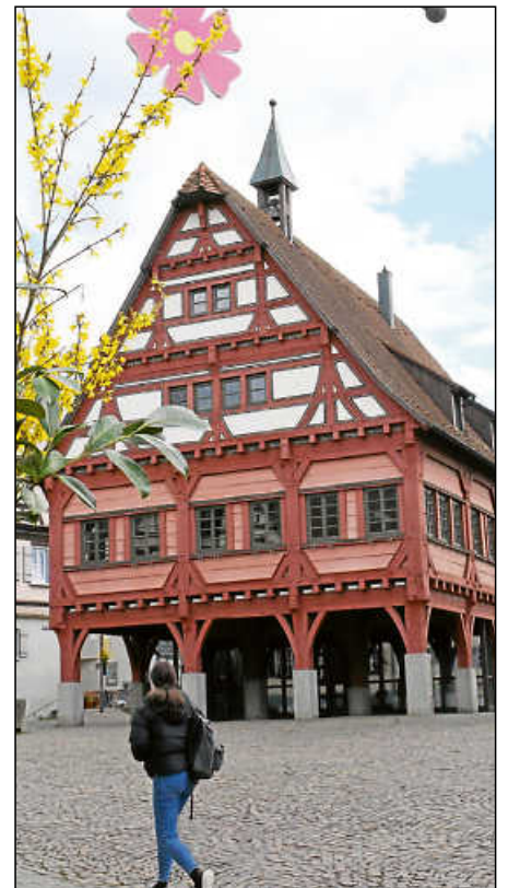
Auch ins Alte Rathaus zieht der Frühling ein.