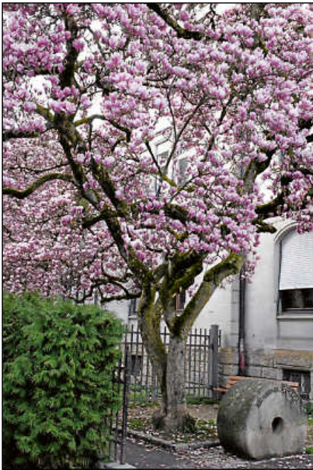
Die Magnolienbäume im Kulturpark Dettlingen blühen für den Augenblick.

Impressionen eines vorösterlichen Spaziergangs – Die Natur steht in den Startlöchern, die kalten Tage sind gezählt