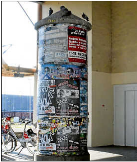
Auf der Litfasssäule am ZOB sitzen die Tauben noch.

Erfolg durch die Rück- und Umbauarbeiten: Nur noch wenige Tauben halten sich am ZOB auf