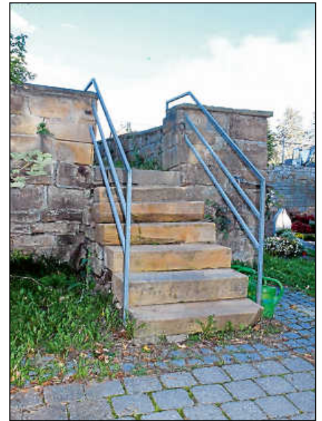
Die Treppe am Parkplatz des Stadtfriedhofs ist nicht barrierefrei. Nun soll sie erneuert, verbreitert und mit neuem Geländer versehen werden.

Einhellig beschlossen die Ausschussmitglieder, die Treppe zu erneuern.