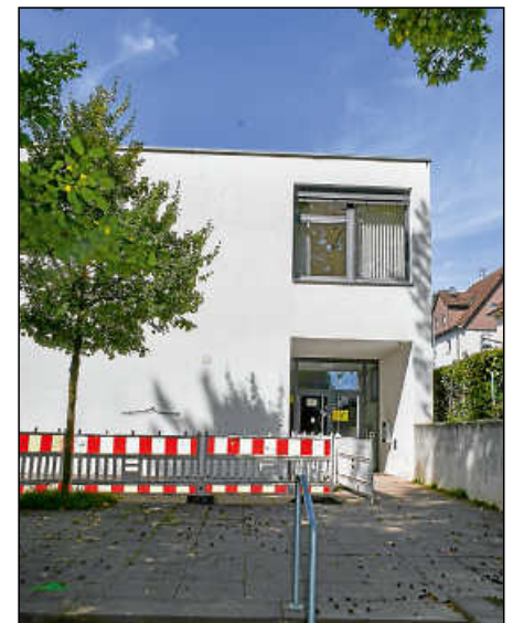
Im letzten Bauabschnitt werden auch noch der Oberstufenbau (hier im Bild) und die „kleine Turnhalle“ saniert.

„Es war absolut richtig, sich fürs Weiterbauen entschieden zu haben“, sagte Bürgermeister Frank Buß zum Gremium.