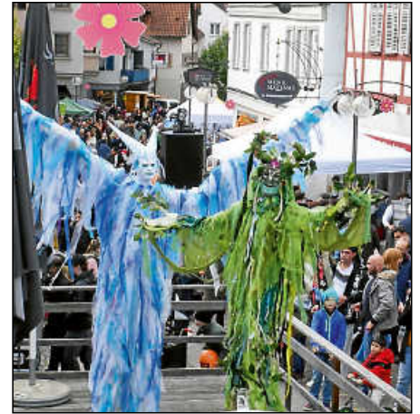
Die Stelzenläufer werden wieder unterwegs sein.