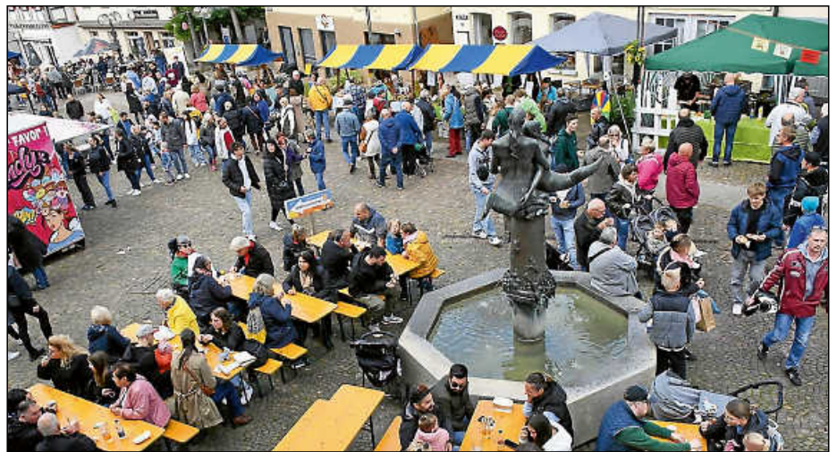
Auf dem Marktplatz findet auch dieses Jahr wieder eine Hocketse statt.

Zahlreiche Einzelhändler sowie viele Dienstleister in der Innenstadt und im gesamten Plochinger Stadtgebiet bieten am verkaufsoffenen Sonntag von 12 bis 17 Uhr tolle Aktionen an. Beim Sonntageinkauf gibt es viele Angebote