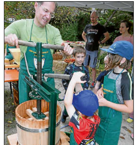
Mit vollem Einsatz an der Presse.

Ursprünglich veranstalteten die SPD Plochingen und die Panoramaschule mehrere Jahre lang ein Apfelfest, teils im Rahmen des Plochinger Herbstes. Äpfel wurden damals unterhalb dem ehemaligen Krankenhaus eingesammelt, das Landratsamt stellte das „Equipment“. Und die Panoramaschule veranstaltete Projekttag zum Thema „Äpfel“, erinnerte sich Annette Krämer-Schmid vom AKPV. Nun knüpfte der OGV an diese Tradition an. Das Wetter spielte mit und während