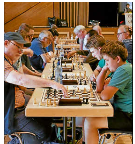
Strategie und viel Hirnschmalz an den Brettern.

Die Schachfreunde Plochingen legen immer auch Wert auf die Basisarbeit in Form von Schulschach in der Burgschule und Jugendschach im Verein.