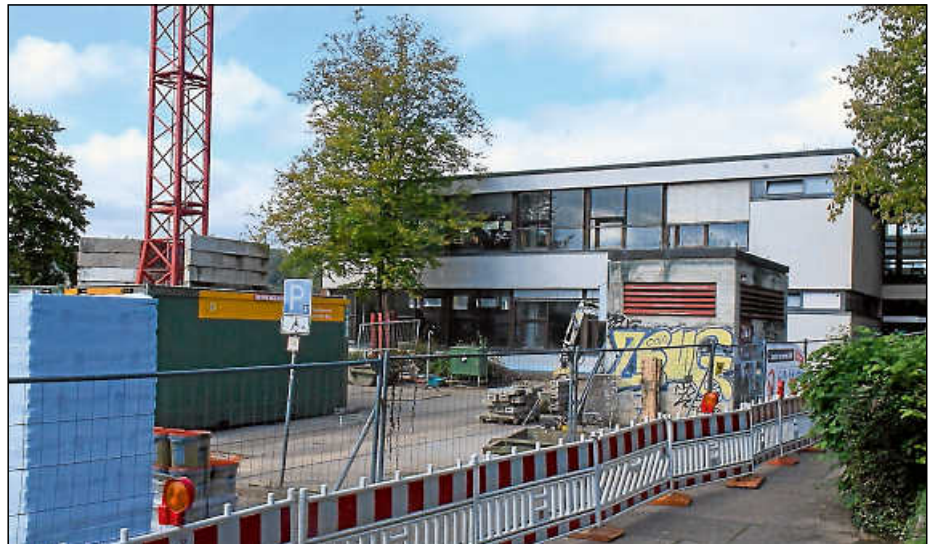
Die Sanierungsarbeiten im Unterstufenbau des Gymnasiums haben jüngst begonnen.

Schließlich stimmten die Mitglieder im Ausschuss auch zu, das Gewerk Automation an die Firma SE-Gebäudeautomation aus Urbach zu vergeben. Ihr Angebot endet einschließlich Wartungsarbeiten