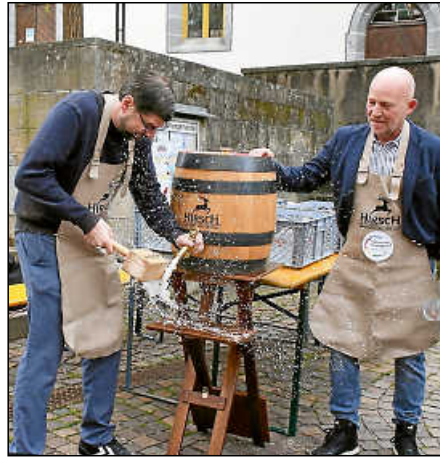
Beim Fassanstich im vorigen Jahr.

Am Sonntag, dem 5. Oktober, wird es herbstlich und vor allem bunt in Plochingen. Das Stadtmarketing Plochingen e. V. veranstaltet den Plochinger Herbst. Ab 12 Uhr öffnen die Türen der Plochinger Einzelhändler und Gewerbetreibenden im gesamten Stadtzentrum für die Kundschaft sowie für Besucherinnen und Besucher aus nah und fern. Dabei wird ein unterhaltsames Programm geboten. Außerdem findet dieses Jahr im Rahmen des Plochinger Herbstes eine gemeinsam vom Stadtmarketing und der Stadt Plochingen veranstaltete Energie- und Umweltmesse im und rund ums Rathaus statt.