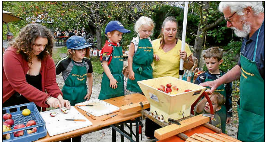
Mit großem Interesse und Begeisterung sind die Kinder bei der Apfelsaftherstellung dabei.