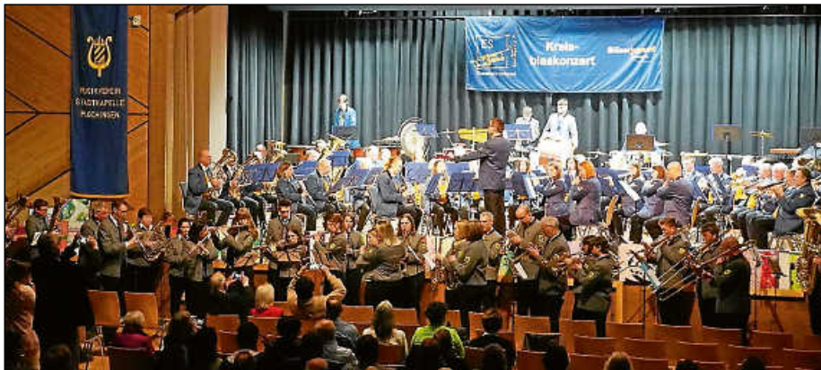
Die Stadtkapelle Plochingen beim gemeinsamen Konzert mit Plochingens Patenverein Aichschieß.

Anlässlich des 100-jährigen Jubiläums bewarb sich die Stadtkapelle Plochingen für das Kreisblaskonzert 2024 des Blasmusikverbands Esslingen e. V. und richtete dieses kürzlich gemeinsam mit dem Musikverein Aichschieß aus.